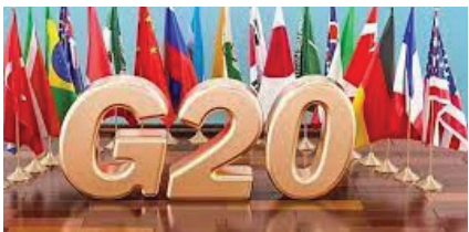
इंदौर/ जन प्रकाशन

इंटेलिजेंस की एक टीम सुरक्षा व्यवस्था का अध्ययन करने पहुंची तिरुवंतपुरम