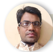
चंकि बाजपेयी सिटी रिपोर्टर