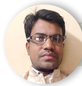
चंकि बाजपेयी सिटी रिपोर्टर

मध्यप्रदेश की आर्थिक राजधानी इंदौर में चहुमुखी और विकास के साथ कई तरह के आयात निर्मित किए जा रहे हैं लेकिन अगर बात की जाए शहर में सुरक्षा की तो आगजनी की घटना को रोकने के लिए लाखों रूपए की कीमत की हाईराइज बिल्डिंगों में आगजनी की घटना को रोकने वाले वाहन की तो वह अभी भी वर्षों से कबाड़ स्थिति में ही खड़ा हुआ है जिसके मेंटेनेंस के लिए 30 से 35 लाख रूपए का खर्च करने को लेकर शासन ने मंजूरी दी है....।